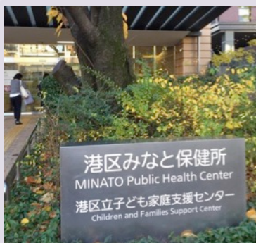
三田1丁目のみなと保健所は 子ども家庭支援センターと併設

みなと保健所 の視察を行いました。港区は全国でも有数の飲食店店舗を有する中で、細菌検査だけではなく食品添加物、保存料や着色料の使用基準の準拠を確認する実験機器や検査室が揃う、東京都の中でも数少ないモデル施設とされています。これからの季節に多く発生するノロウイルスや夏に懸念されるデングウイルスなど、迅速に対応できる検査体制の確保はやはり必要です。