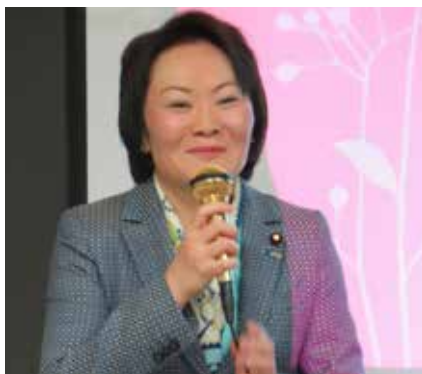
東京1区 衆議院議員 山田 美樹様