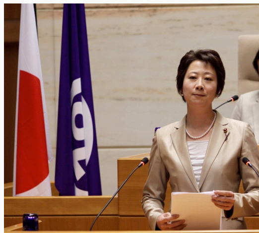
平成29年2月、港区議会本会議場にて

高齢者が要介護状態になっても住み慣れた地域で自分らしい生活を最期まで送れるように、地域が支え合う社会システム